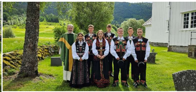
Konfirmasjon i Valle kyrkje

Litt kult at våre gutar var med i promotering av konfirmantleiren konfACTION