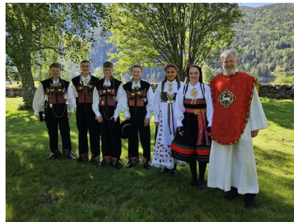
Konfirmasjon i Hylestad kyrkje