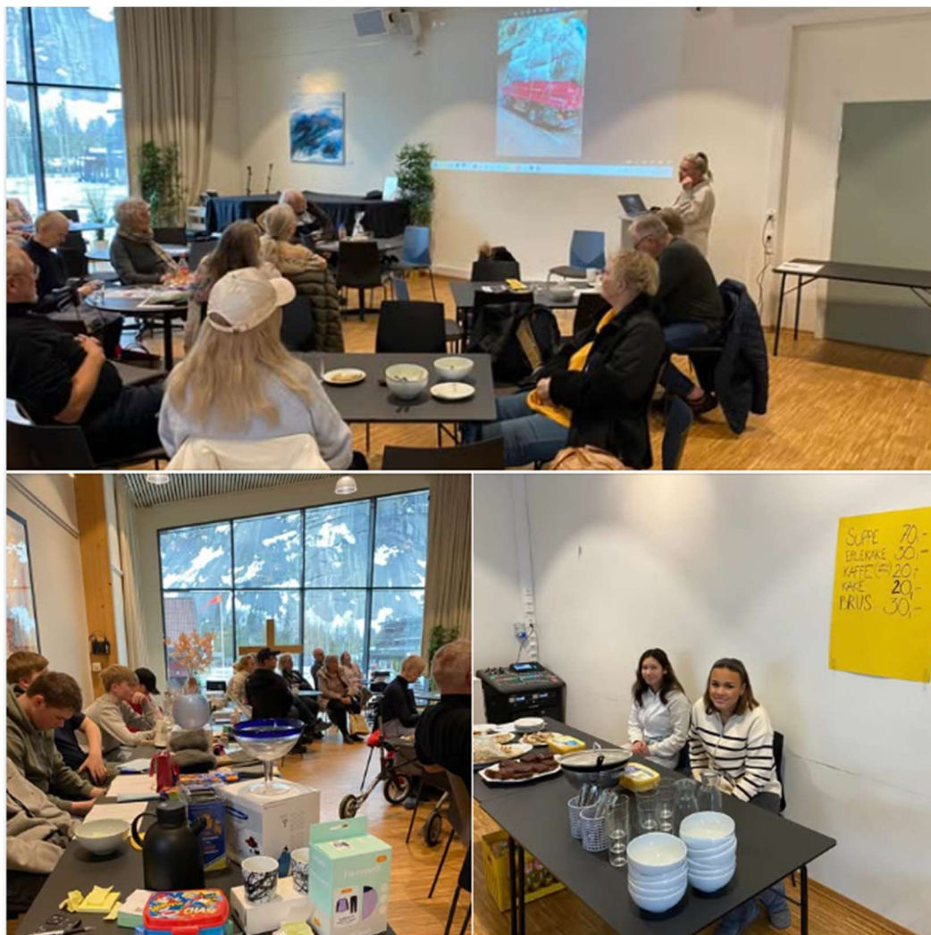
Frå konfirmantbasaren laurdag 1. mars 2024 til inntekt for Stefanusborna