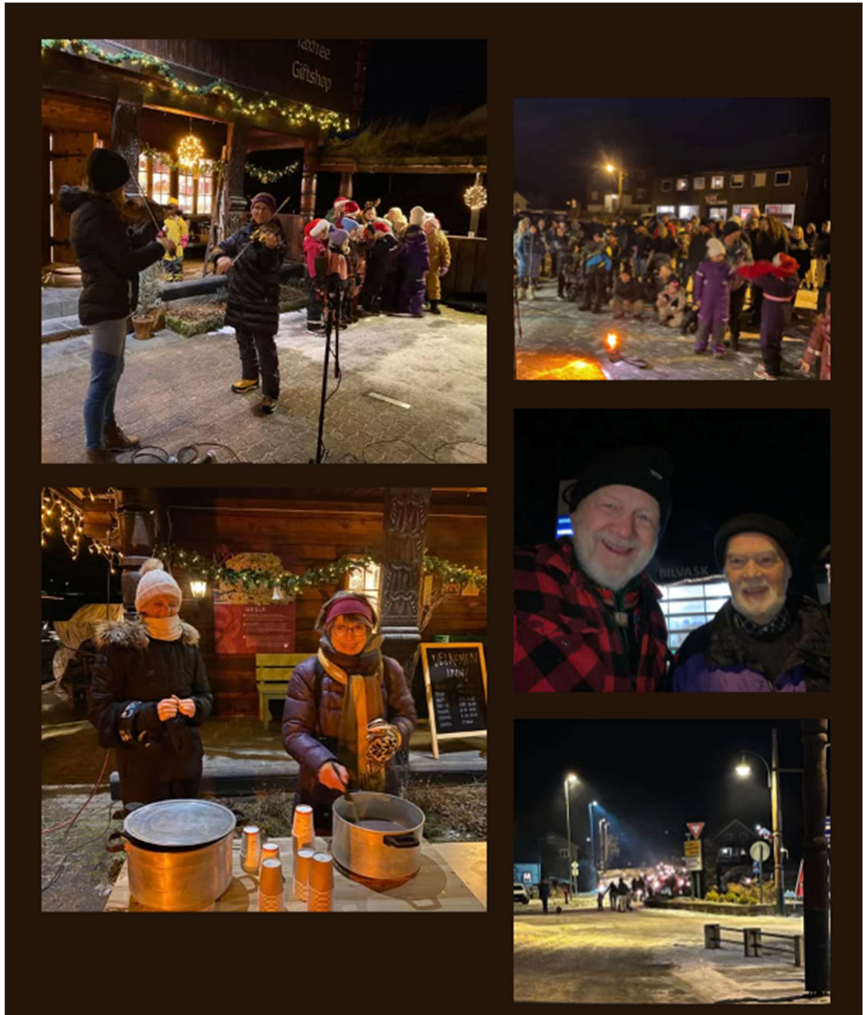
Frå tenning av jolegran i Valle sentrum og fakkeltog til Bygdeheimen, fredag før 1. søndag i advent

I år vart fakkeltoget flytta til fredag før 1. søndag i advent. Det var eit særst godt samarbeid med Valle kommune, Valle sentrumsforening og Valle bygdekvinnelag. Etter evaluering vil ein halde fram med å ha fakkeltoget fredag før 1. søndag i advent neste år.